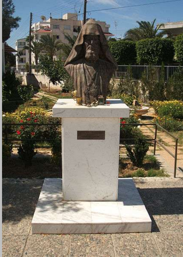
The bust of Archbishop Zareh Aznavorian in Cyprus

IN MEMORY OF ARCHBISHOP ZAREH AZNAVORIAN (1947-2004)