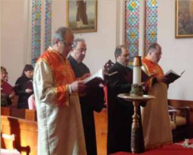
Sunrise Service ( Arevakal ) at the Cathedral