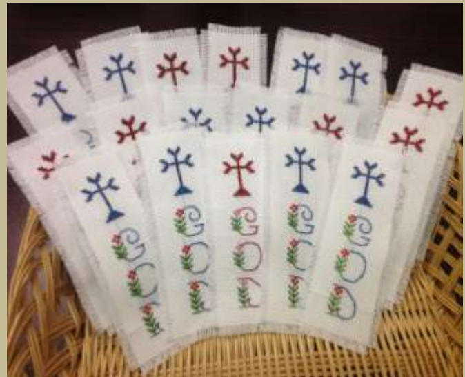
Souvenirs given to the Seminar participants by St. Illuminator's Sunday school