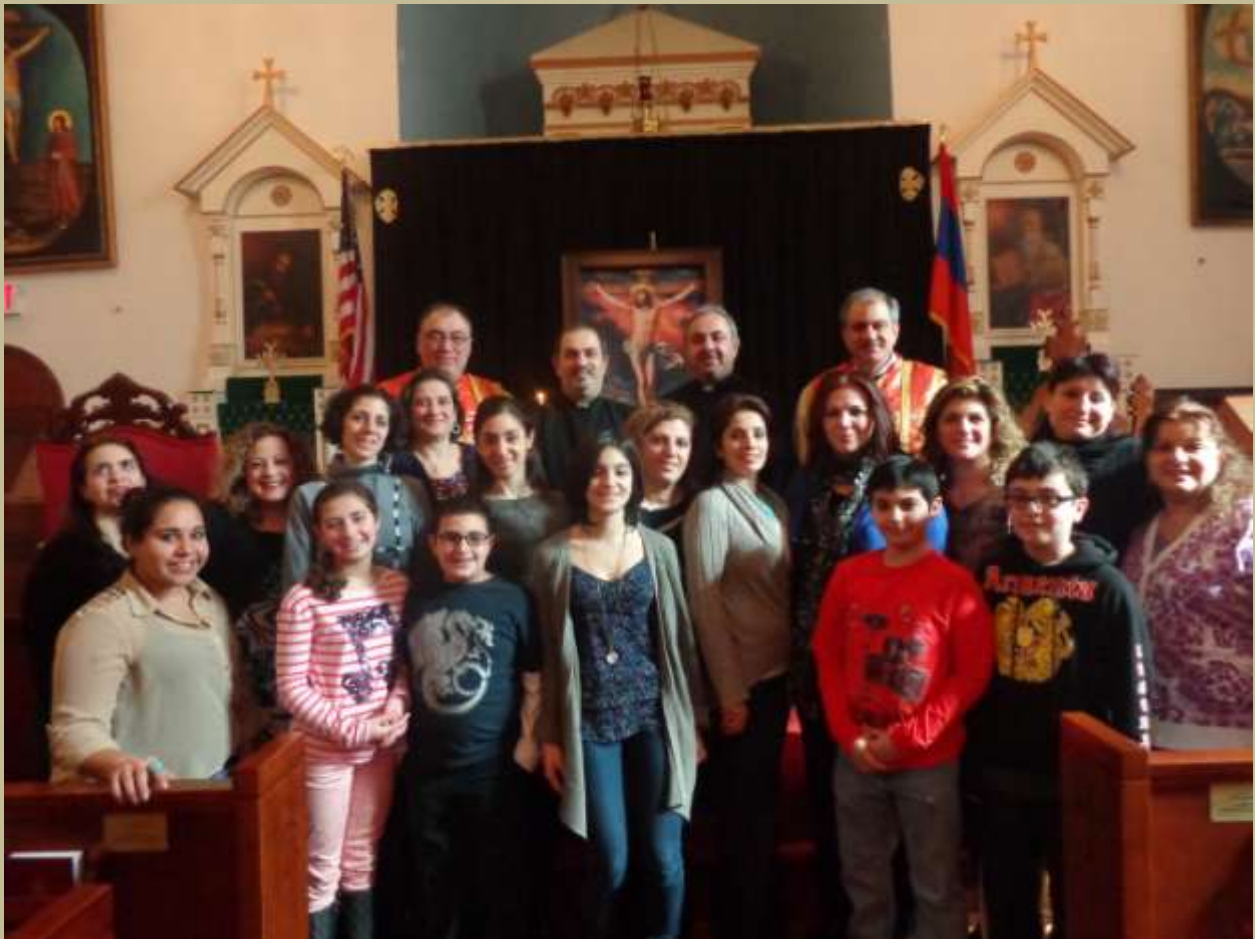
NEW YORK, NEW JERSEY REGIONS SUNDAY SCHOOL TEACHERS SEMINAR AT THE ST. ILLUMINATOR'S CATHEDRAL

221 East 27 th Street, New York, NY 10016 Tel: 212-689-5880 Fax: 212-889-1174 E-Mail: office@stilluminators.org Website: www.stilluminators.org