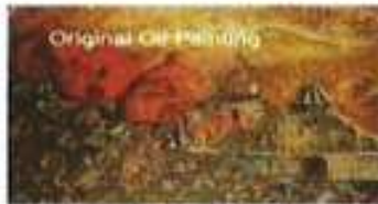
Original Oil Painting

Armenian Relief Society is a 501 (c)(3) non profit organization