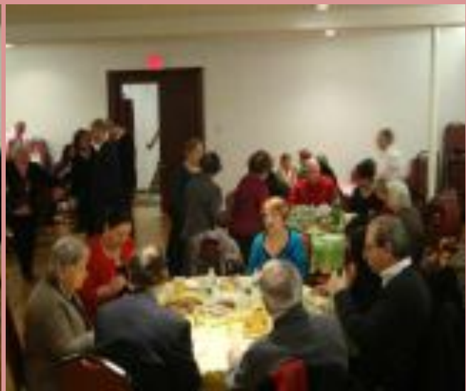
Parishioners enjoy Mid-Lenten Luncheon