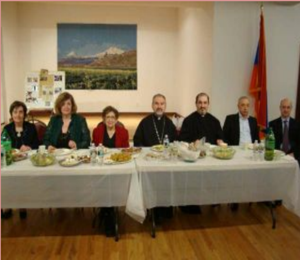
MID-LENTEN (MICHINK) LUNCHEON AT THE ST. ILLUMINATOR'S CATHEDRAL

221 East 27 th Street, New York, NY 10016 Tel: 212-689-5880 Fax: 212-889-1174 E-Mail: office@stilluminators.org Website: www.stilluminators.org