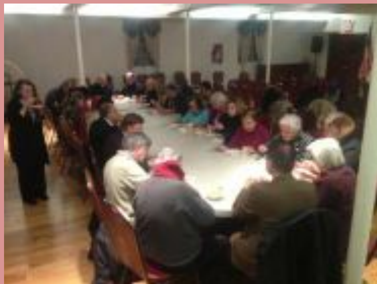
Lenten program featured an open discussion about various issues of interest