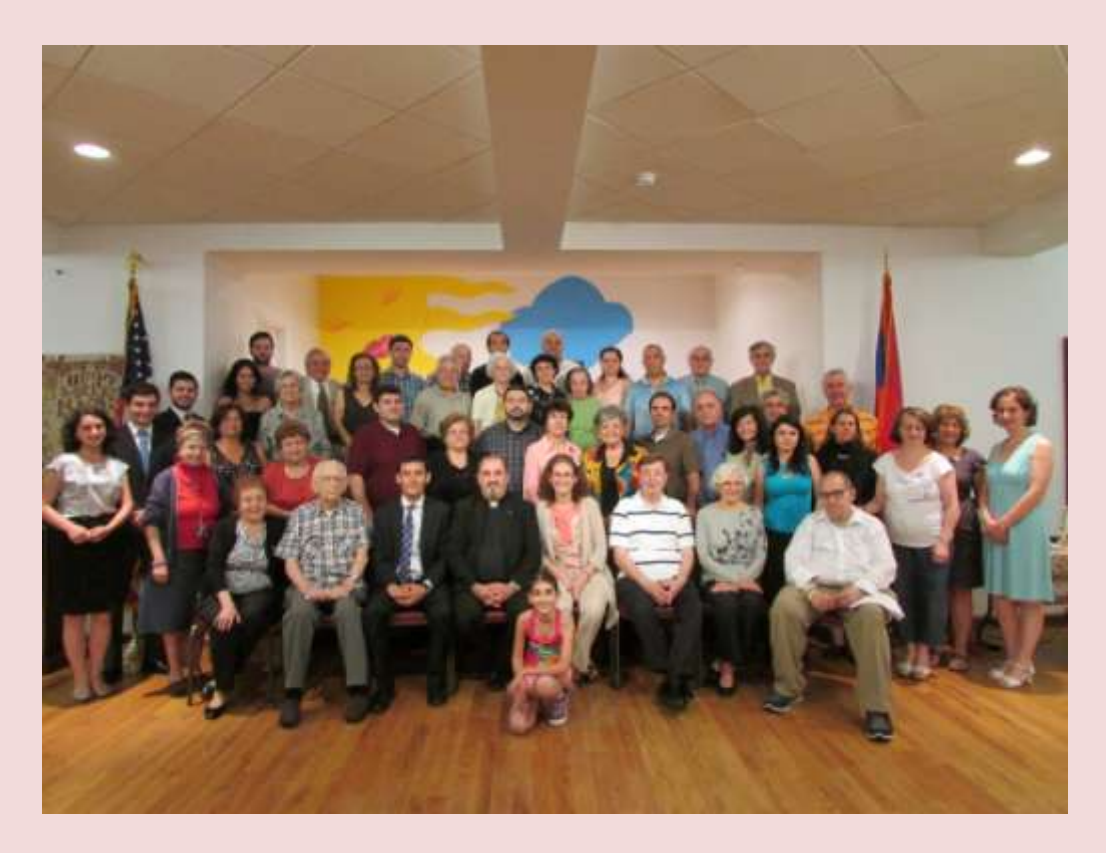
Last night "History of Armenia: past, present, future" Series of Seminars concluded

221 East 27<sup>th</sup> Street, New York, NY 10016 Tel: 212-689-5880 Fax: 212-889-1174 E-Mail: office@stilluminators.org